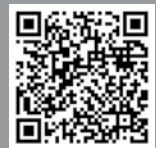
ساخت ظروف سفالی